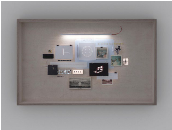
One Last Day, 2023. 107 x 66 x 16,5 cm Contreplaqué bouleau, verre, peinture acrylique, polyester, PMMA et ruban Led. Exemplaire unique