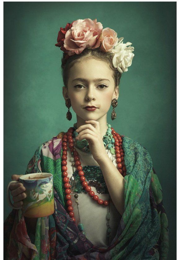
The Chocolate Mustache (2020) Photographie 90x60cm – Mathilde Oscar

En Occitanie, cette Foire, à la fois régionale et cosmopolite, mobilise un large public de collectionneurs et d'amateurs d'art, en égalant son record de fréquentation de la précédente édition soit 13 000 personnes.