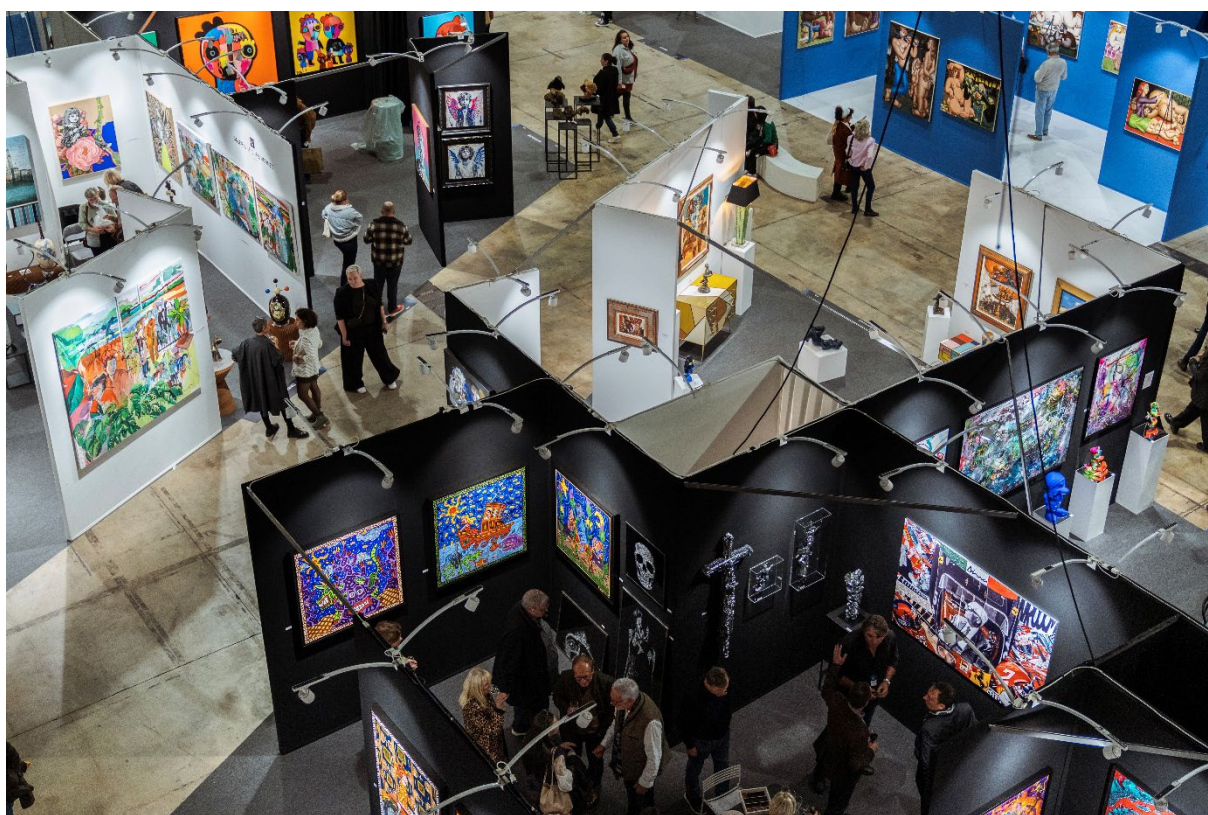
Art Montpellier 2025

À leurs côtés, le public a retrouvé plusieurs grands noms français qui comptent parmi les incontournables d'Art Montpellier, avec des œuvres de Robert Combas, Hervé Di Rosa (AD Galerie) et Ernest Pignon-Ernest (Corps et Ame Gallery), affirmant une nouvelle fois la place centrale qu'occupent ces artistes dans le paysage artistique national.